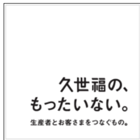
▲このシールが目印です

全国各地の和食材を取り扱う久世福商店ですが、バイヤーが各地の生産者様を訪問してよく目にするのが、商品の切れ端や形がいびつで正規品としては取り扱えないもの。見た目はイマイチでも味はとっても美味しいから、もっと活用していきたい！そんな生産者様やバイヤーの声を形にしたのが「久世福の、もったいない。」シリーズです。