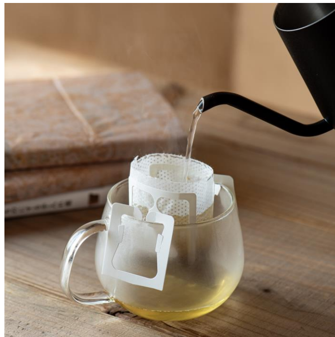
▲おだしの香りに包まれ、雫が落ちていく様子も癒しの時間になってほしい。そんな想いで名づけられた「雫だし」です。