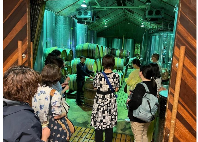
▲ワイナリーにて。発売前のワイン試飲も楽しんでいただきました。