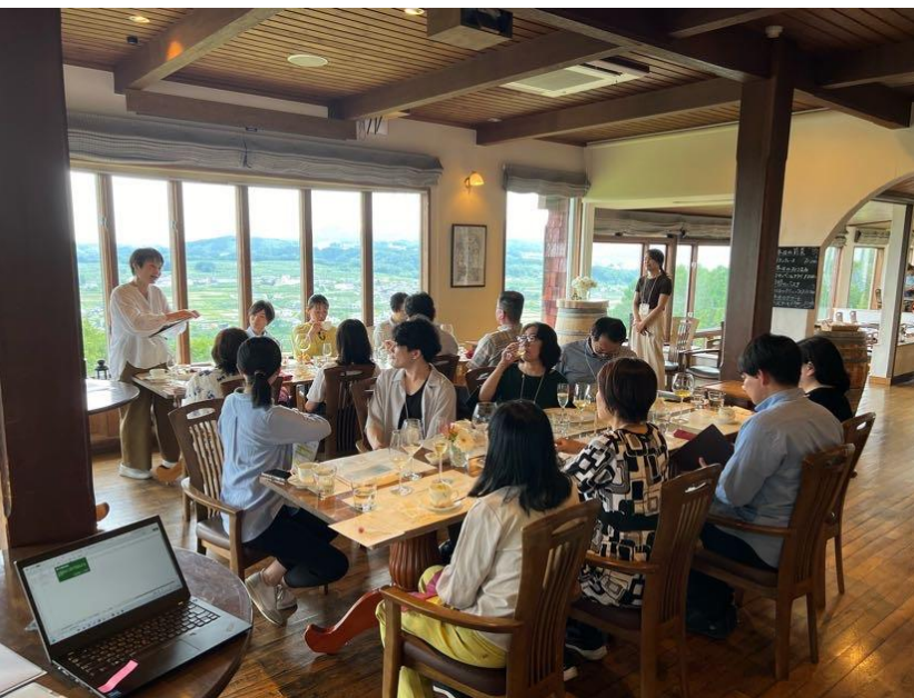
◀レストランでのお食事と座談会。 ソムリエ厳選のサンクゼールワインと、シェフ自慢のコース料理とのマリアージュを存分に楽しんでいただきました。 座談会では、サンクゼールのスタッフのみならず、ご参加いただいた会員様同士のコミュニケーションも活発に行われ、サンクゼールに対する熱い想いが飛び交う、非常に有意義な時間となりました。