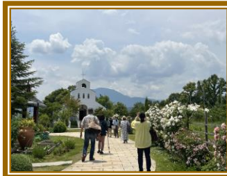
◀「サンクゼールの丘」はどこを切り取っても絵画のような美しい景色が広がる場所です。 この時期はバラが満開を迎え、甘い香りが辺り一面に漂っています。