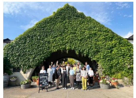
ご参加ありがとうございました！