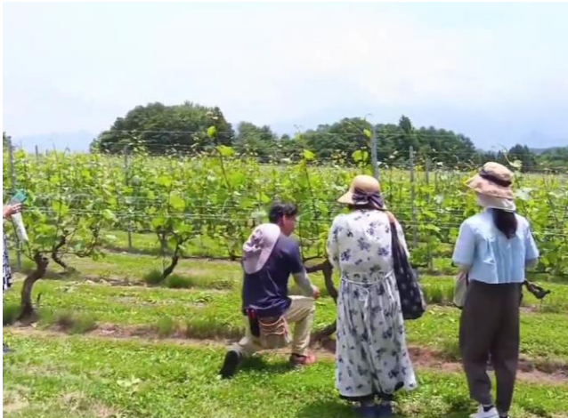
▲広大なヴィンヤード（ぶどう畑）にて。ぶどうの成長に関するレクチャーに、熱心に耳を傾ける参加者の皆さん。