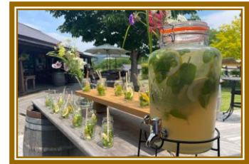
▲ウェルカムドリンクのりんごサイダー